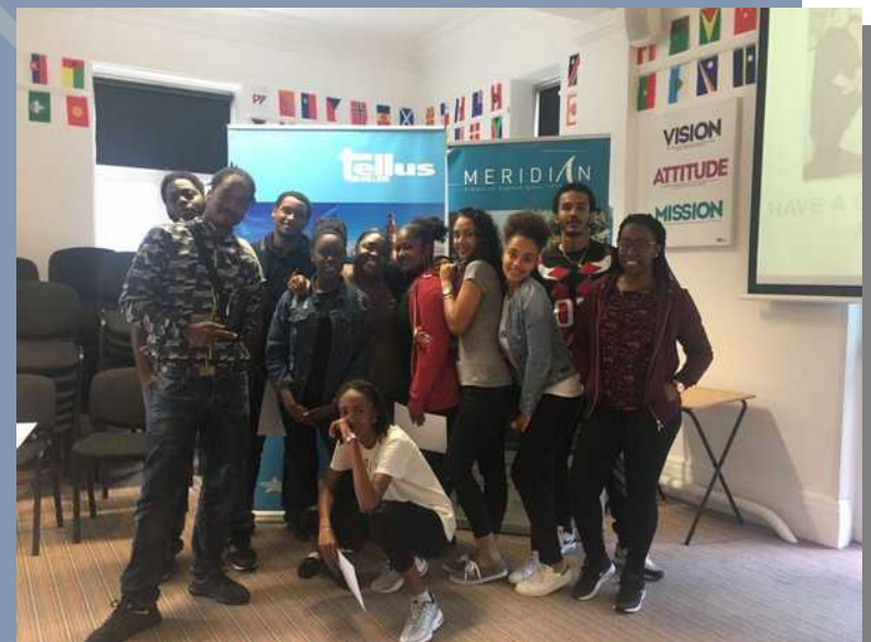
Plymouth, le 2 Aout 2017

Cette expérience est enrichissante à plus d'un titre : certains goûtent la dure séparation de neuf