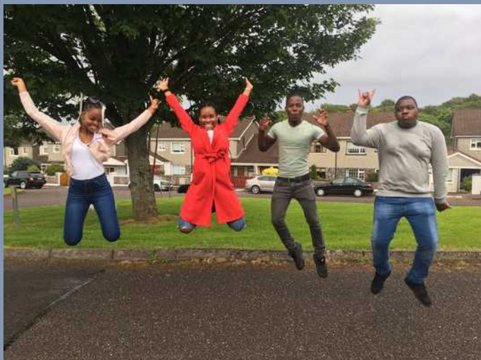
Cork, le 5 Juillet 2017