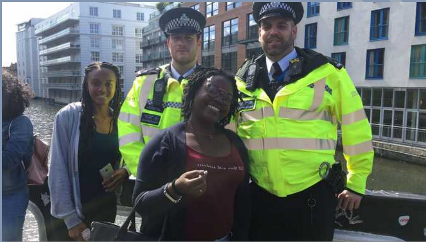
Londres, le 8 Juin 2017

Des rencontres gravées à jamais dans nos esprits.